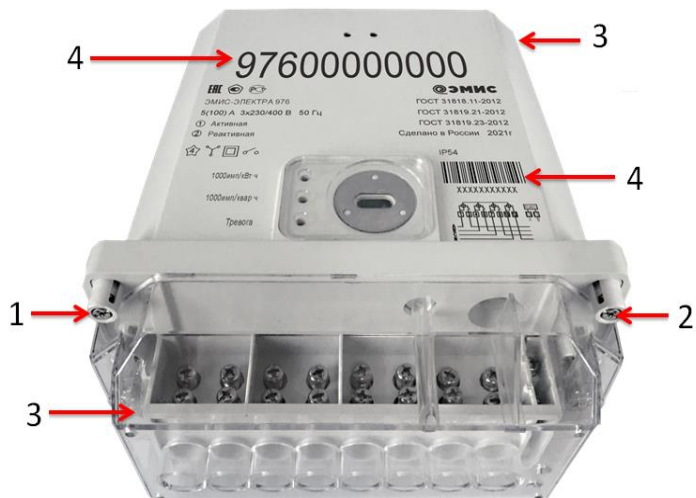
Рисунок 1 – Общий вид счетчика исполнения «С» со схемой пломбировки

Общий вид счётчиков со схемой пломбировки от несанкционированного доступа и места нанесения знака поверки представлен на рисунке 1 и рисунке 3. На рисунке 2 показан общий вид дополнительного устройства индикации ЭМИС-ЭЛЕКТРА 130.