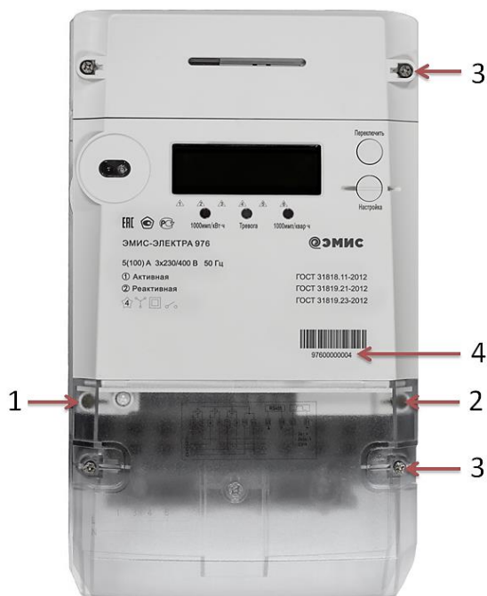
Рисунок 3 – Общий вид счетчика исполнения «Х» со схемой пломбировки